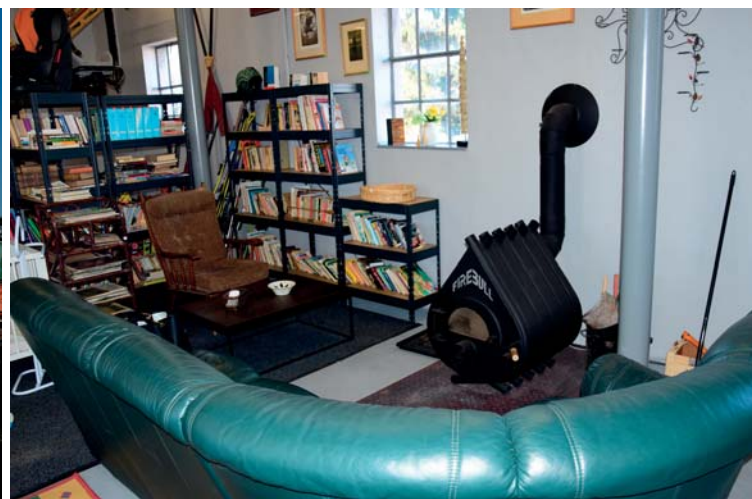
Re-use centrum je v provozu od loňského června. Koncipované je jako knihovna s čítárnou, sportovní koutek, obývací pokoj a kuchyň