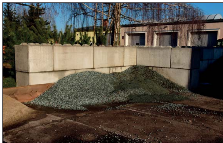
V areálu TSMJ se na shromažďování různého materiálu dobře osvědčil betonový tzv. LEGO systém. Přispívá k udržování pořádku, lze ho jednoduše přesunout na jiné místo a instalovat bez stavebního povolení