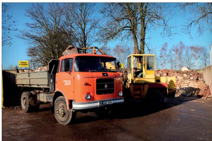
Nejenom ve sběrném dvoře doposud dobře slouží letos čtyřicetiletý nákladní automobil, trambus Škoda 706 MTS P25 – Mates