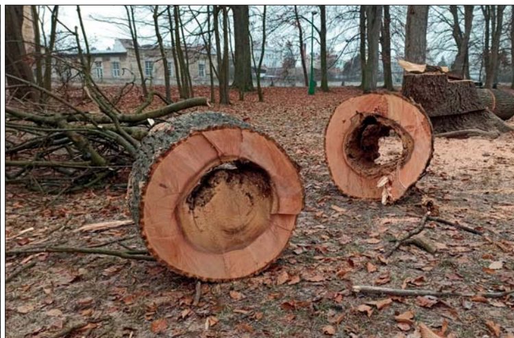
Novou akvizicí TSMJ je nakladač Kramer 8085T. Podílí se na manipulaci s dřevní hmotou z pokácených stromů. Druhý snímek ukazuje, že jde o nutné zákroky

padu. V únoru jsme vytřídili prvních 40 m 3 dřevitého odpadu.“