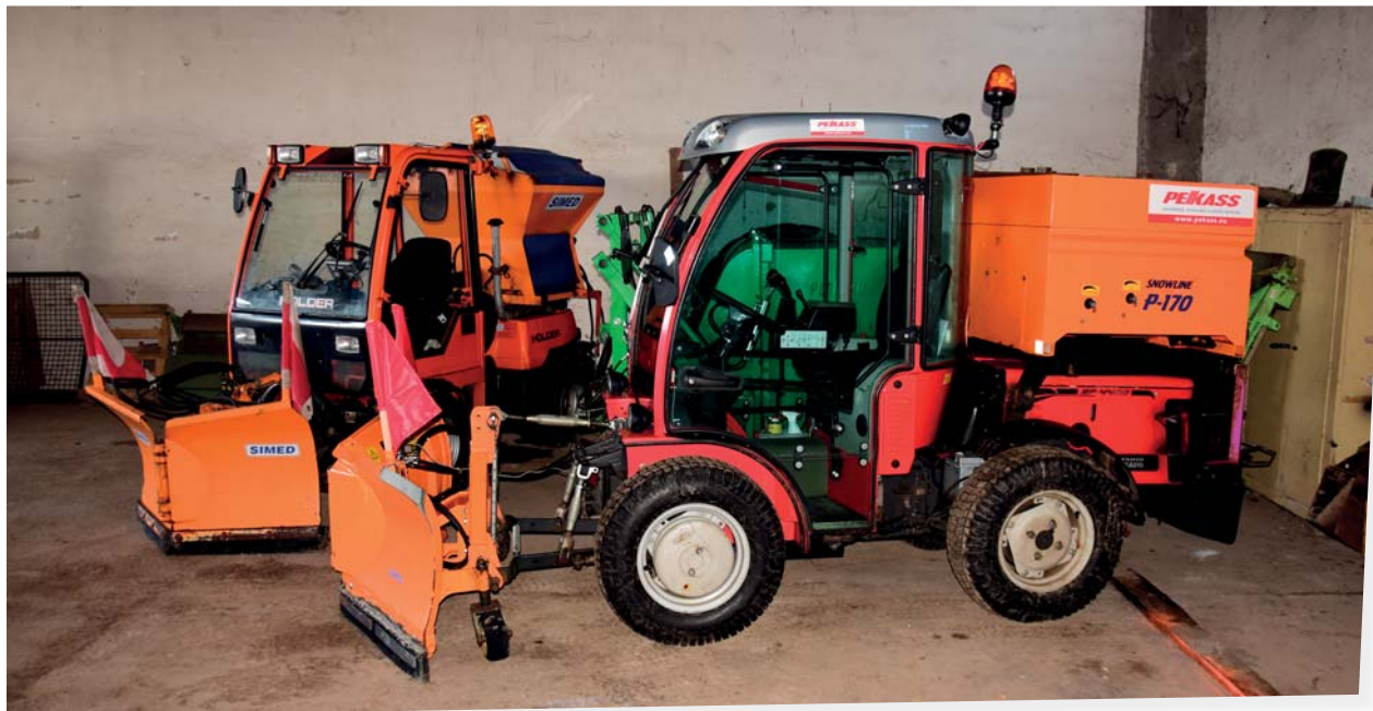
Zhruba o šedesát kilometrů chodníků se po celý rok starají univerzální nosiče nářadí Antonio Carraro a Holder